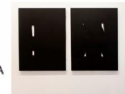
NEGRO SOBRE BLANCO N16 _ ACTO DE COMUNICACIÓN N41 (PELIGROSOS SOCIALES) M Díptico 130x206 cm c/u 130x98 cm A 2022 T Acrílico sobre lienzo