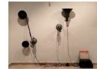
3 La pérdida de la EXPRESSION SPONTANEE_ ACTO DE COMUNICACIÓN N49