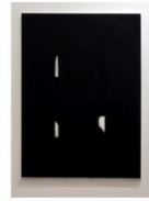
NEGRO SOBRE BLANCO 10 _ ACTO DE COMUNICACIÓN N41 (FUTURO) M 180x15;30 cm A 2022 T Acrílico sobre lienzo