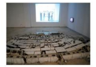
EL MURO_ ACTO DE COMUNICACIÓN N20 T Video instalación. A 2017 Fragmento del Muro de bloques de hormigón, pintura acrílica. Videos documento de la acción. Proyección 2,21 minutos Video tv 3 minutos. Bloques de hormigón, medidas trozo de muro 180x40x20 cm