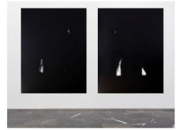
NEGRO SOBRE BLANCO 10 _ ACTO DE COMUNICACIÓN N41 (ATAQUE SUBLIMINAL) M Díptico 300x195 cm M c/u 195x150 cm A 2022 T Acrílico sobre lienzo