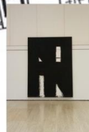
1 NEGRO SOBRE BLANCO _ ACTO DE COMUNICACIÓN N41 NEGRO SOBRE BLANCO N5_ ACTO DE COMUNICACIÓN N41 (FIN) M 260x195cm. A 2020 T Acrílico sobre lienzo, madera.